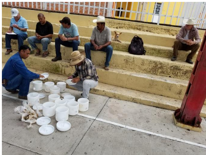
Fig. 1. Platica de capacitación a productores de agave.

En el mes de julio de 2018 el picudo del agave se encuentra bajo control fitosanitario en los seis municipios atendidos en la campaña Contra Plagas Reglamentadas del Agave, los cuales son Tepic, Xalisco, Santa María del Oro San Pedro Lagunillas, Ahuacatlan e Ixtlan del Rio. La superficie afectada en el estado de Nayarit es de 503.80 hectáreas.