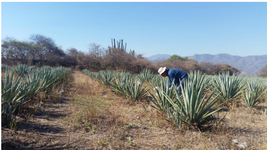
Fig. 1. Revisión de trampa en predio de agave.

En el mes de febrero de 2018 el picudo del agave se encuentra bajo control fitosanitario en los seis municipios atendidos en la campaña Contra Plagas Reglamentadas del Agave, los cuales son Tepic, Xalisco, Santa María del Oro San Pedro Lagunillas, Ahuacatlan e Ixtlan del Rio.