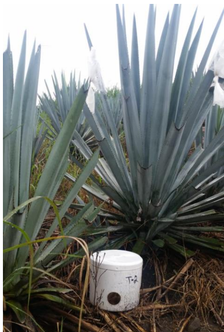
Fig. 1. Trampa para captura de picudo del agave.

En el estado de Nayarit se reportan 5,181.94 hectáreas de agave establecidas en los 8 municipios con Denominación de Origen del Tequila (SIAP, 2016), durante el ejercicio 2016 el SIAP reporta una producción de aproximadamente 34,065.65 toneladas de agave lo que represento a una derrama económica en el estado de $ 238.108 millones de pesos.